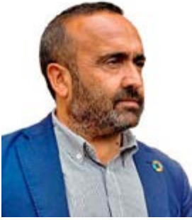
MIGUEL ÁNGEL MORALES

Presidente de la Diputación Provincial de Cáceres